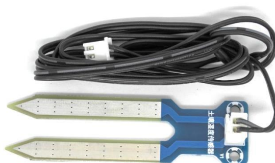
Рис.3 Датчик влажности Размеры: 72x20мм Длина погружаемой части: 46мм Длина провода: 1м

Вопросы по эксплуатации и модернизации модуля под ваши задачи присылайте на kitsupport@ukr.net