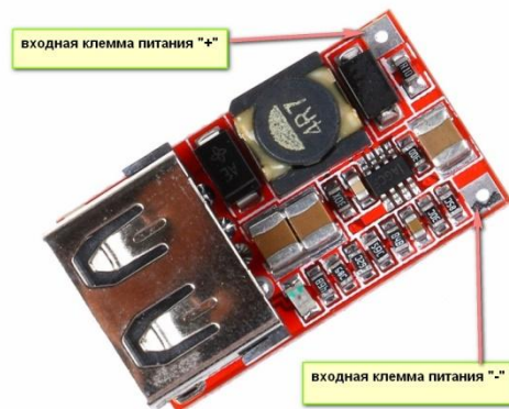
Рис.3 Полярность подключения питания

Благодаря низкому току потребления без нагрузки (0,85мА), модуль можно подключать к бортовой сети автомобиля без дополнительного выключателя.