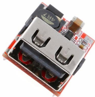
Рис.1 Выходной разъем USB-A

Выходное напряжение снимается с разъема типа USB-A, что максимально облегчает подключение позволяя использовать стандартный USB кабель.