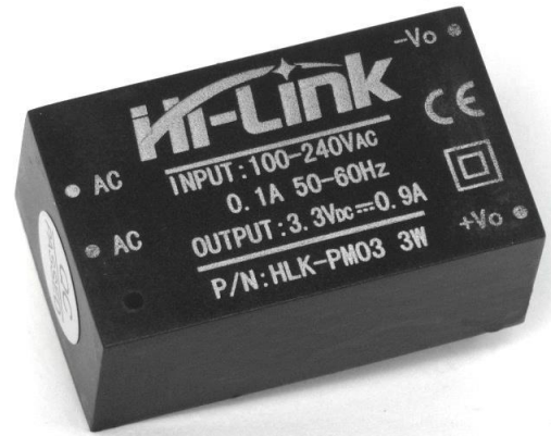
Рис.2 Внешний вид устройства

Вопросы по эксплуатации и модернизации модуля под ваши задачи присылайте на kitsupport@ukr.net