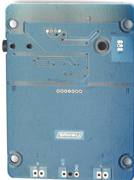
Рис.3 Обозначение контактов (размеры модуля: 71x52мм)

Техническая поддержка наборов Master kitsupport@ukr.net